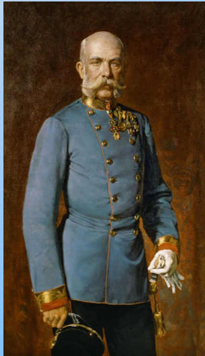
František Josef I.

http://cs.wikipedia.org/wiki/Soubor:Kaiser_franz.jpg