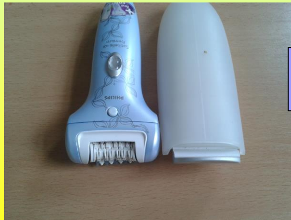
Philips epilátor s ochlazovačem pokožky