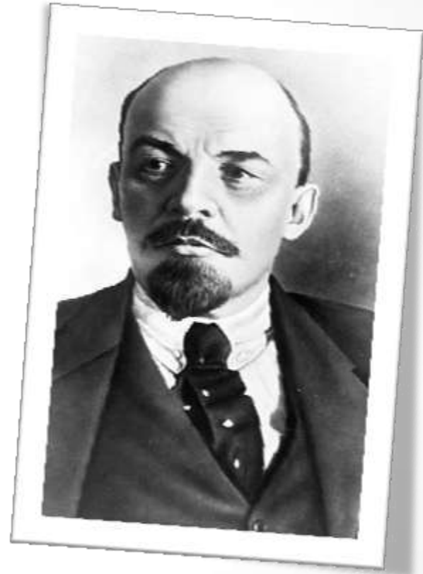
B) VLADIMÍR ILJIČ LENIN