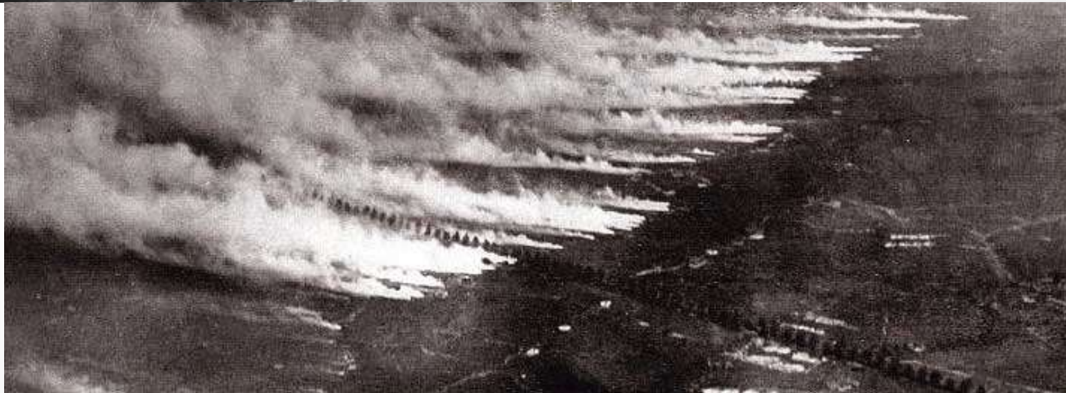
III. Německý liniový útok bojovým plynem během první světové války