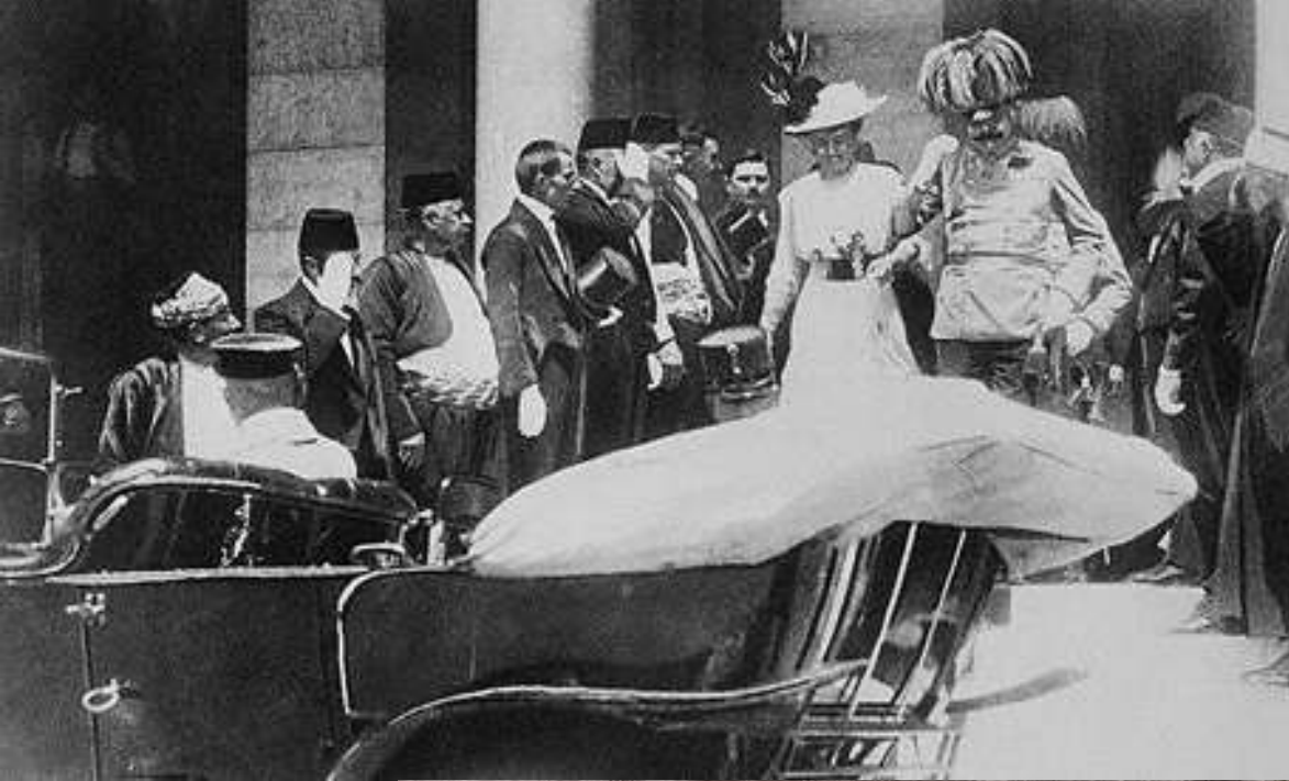
II. Arcivévoda František Ferdinand d'Este s manželkou v Sarajevu před atentátem