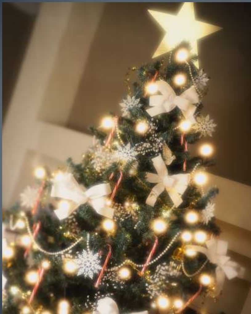
Dekorace včetně osvětlení