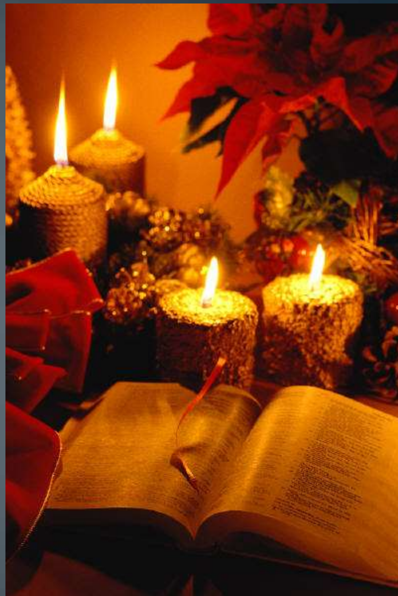
Otevřený oheň nepoužíváme!!!