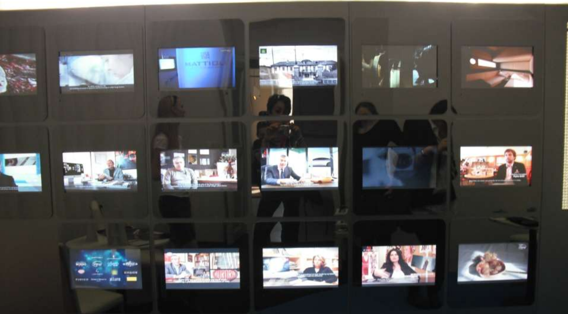
Panel s LCD obrazovkami - multizobrazení