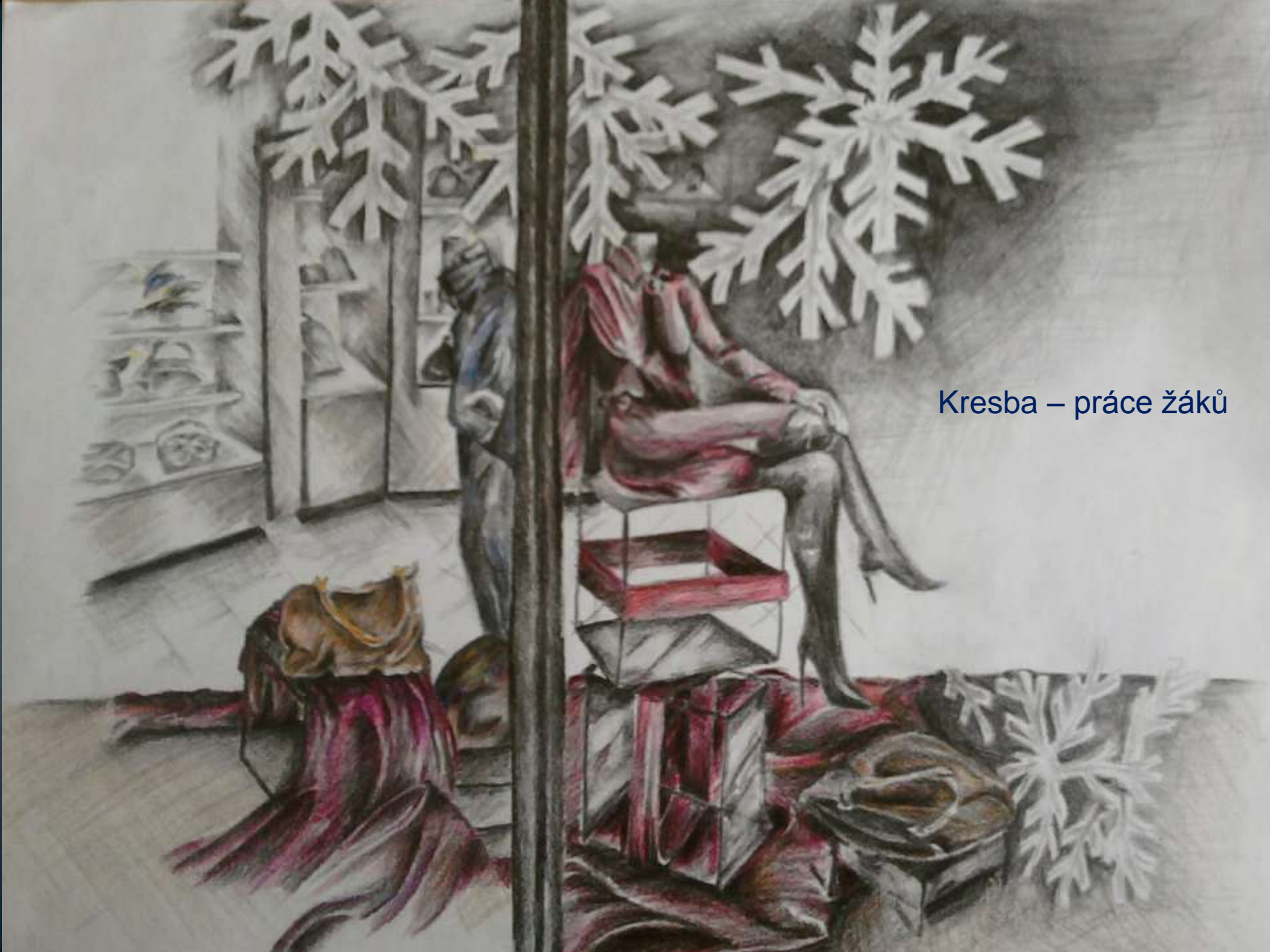
Kresba – práce žáků