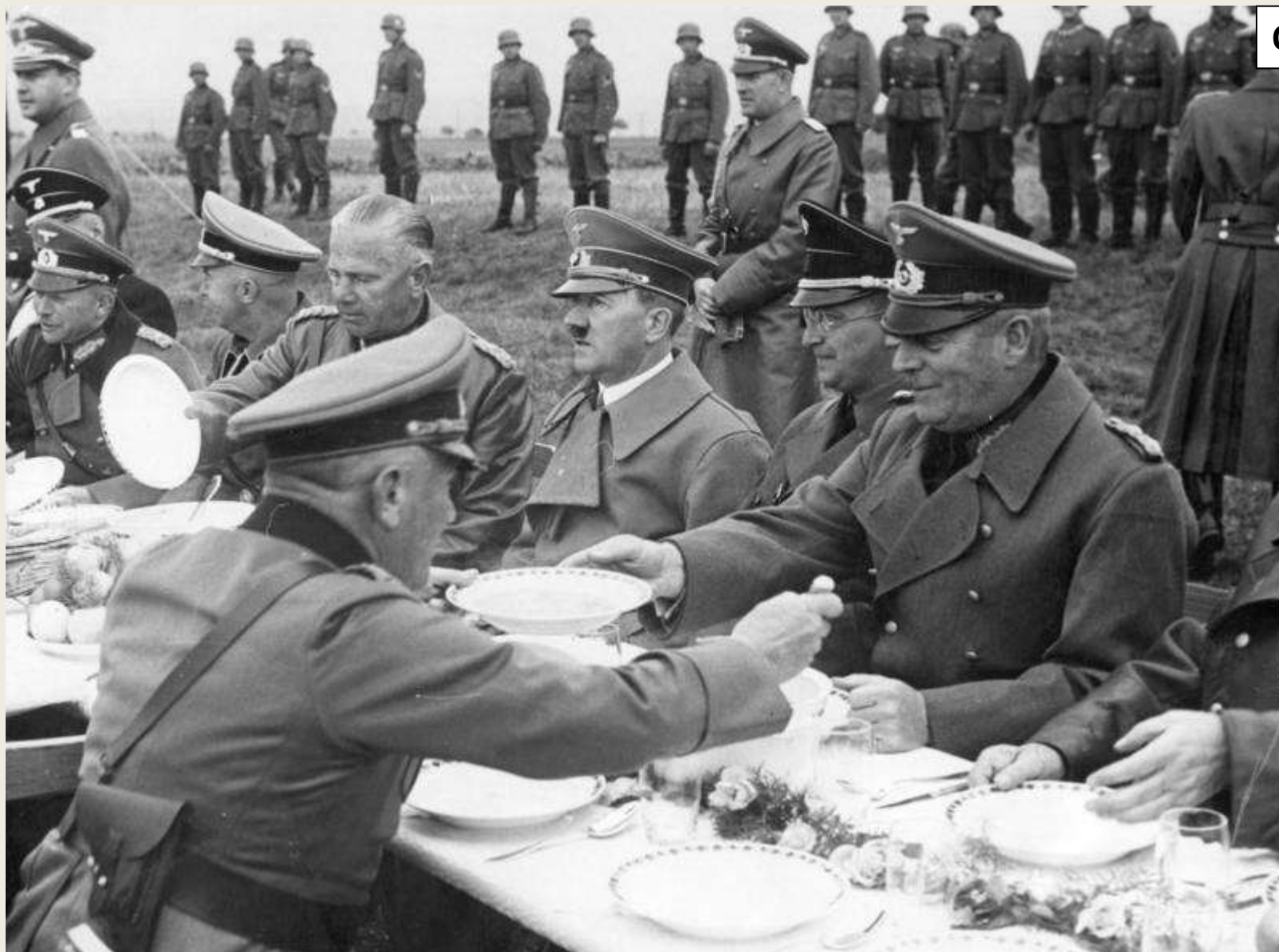
3. 10. 1938 Hitler při návštěvě v Sudetech, v brýlích vedle něj Konrád Henlein