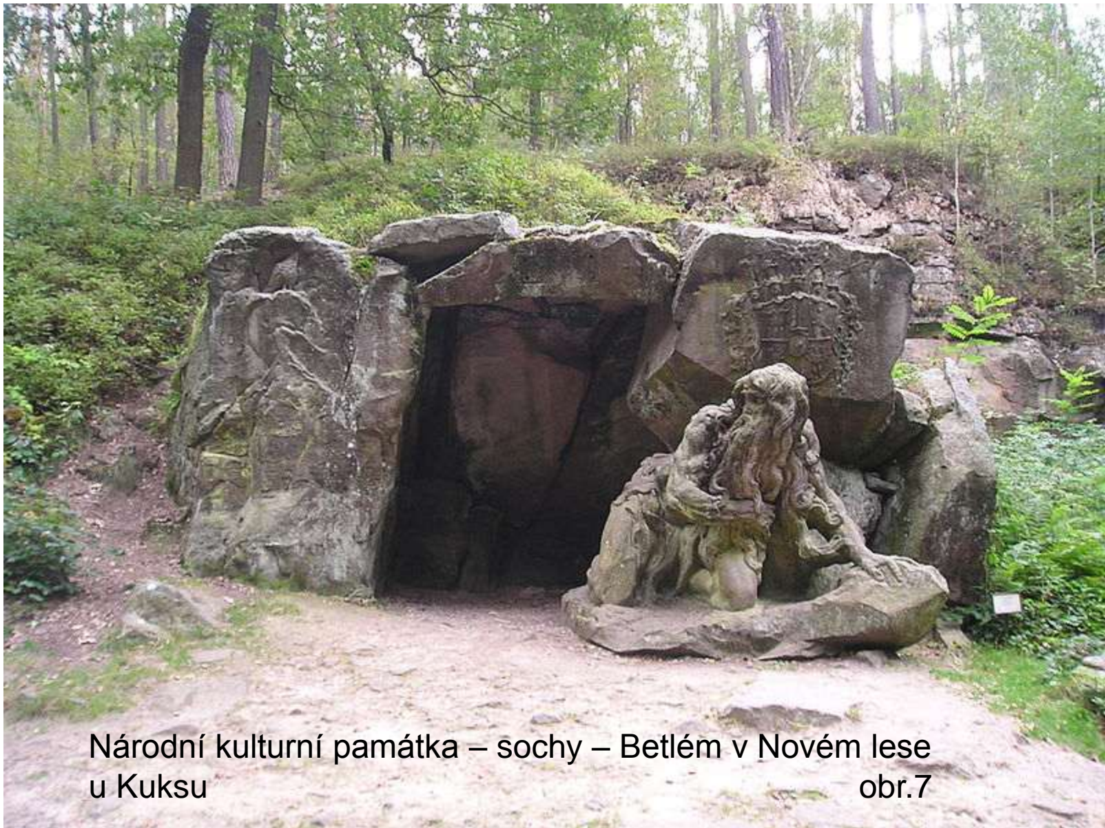
Národní kulturní památka – sochy – Betlém v Novém lese u Kuksu obr.7