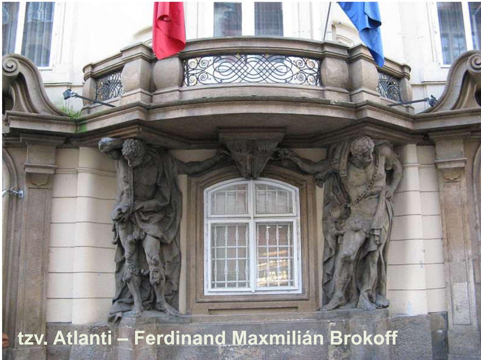
tzv. Atlanti – Ferdinand Maxmilián Brokoff