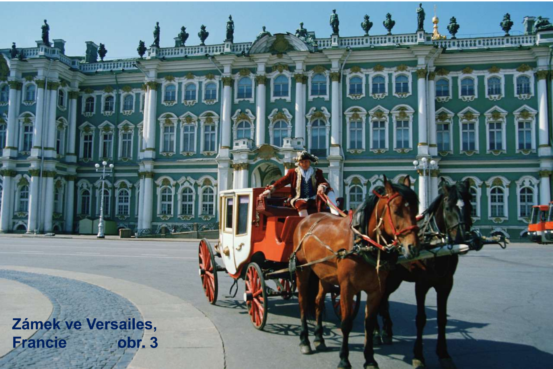
Zámek ve Versailles, Francie obr. 3