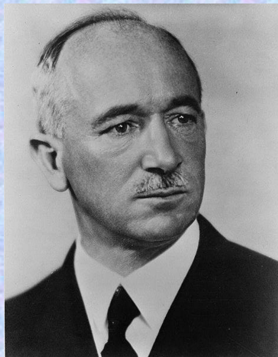
Tomáš Garrigue Masaryk