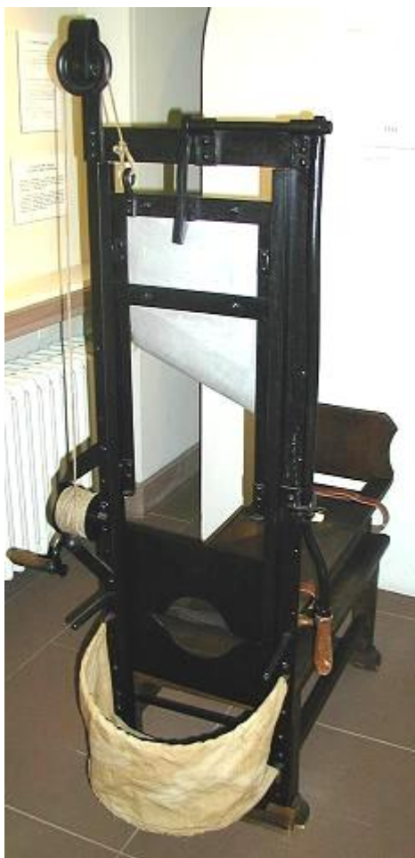
gilotina Maxmilien Robespierre