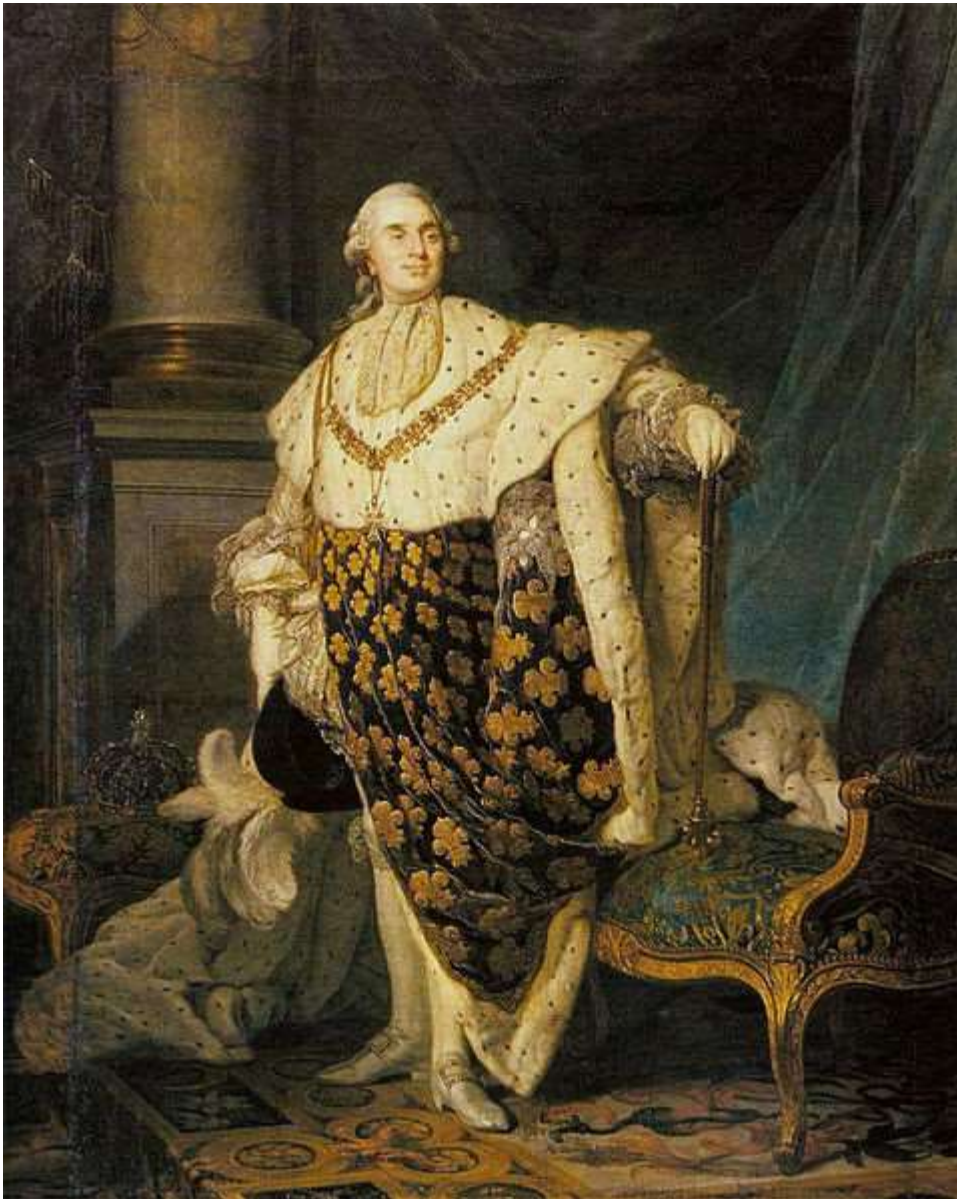
Francouzský král Ludvík XVI.