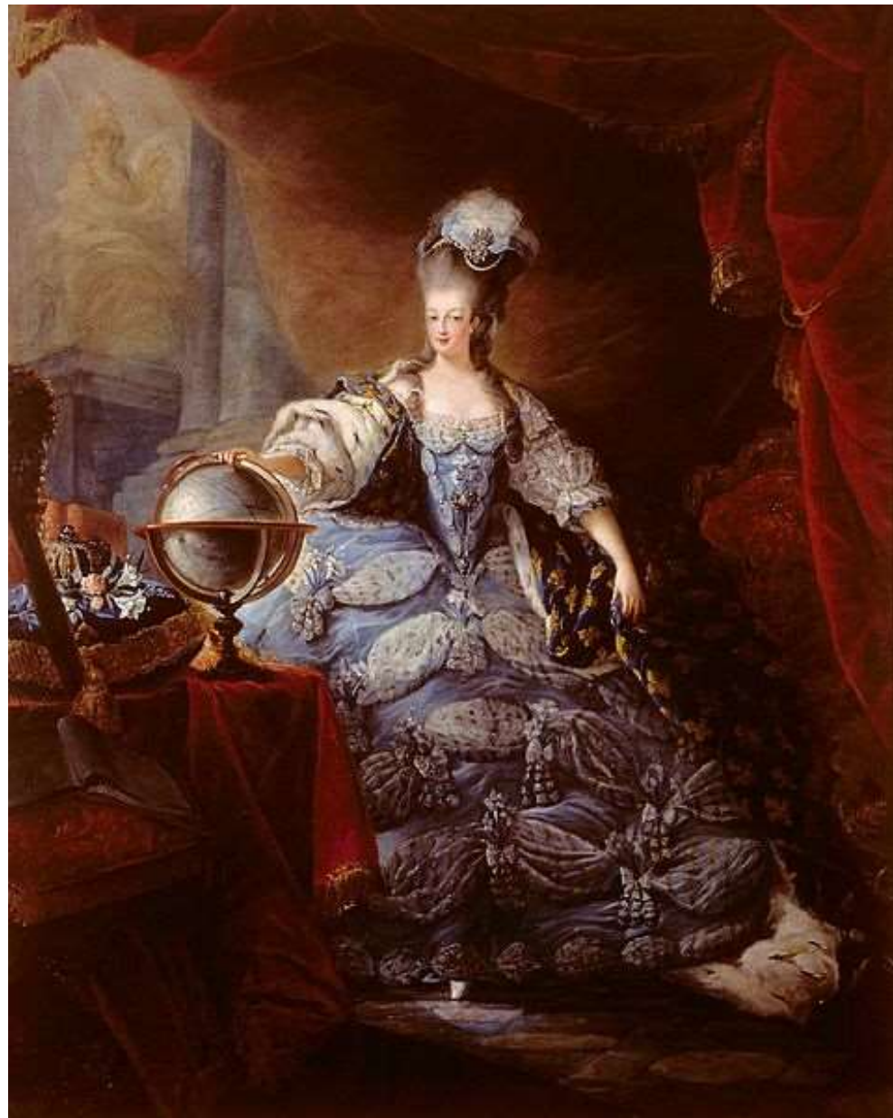
Marie-Antoinette, dcera rakouské císařovny Marie Terezie