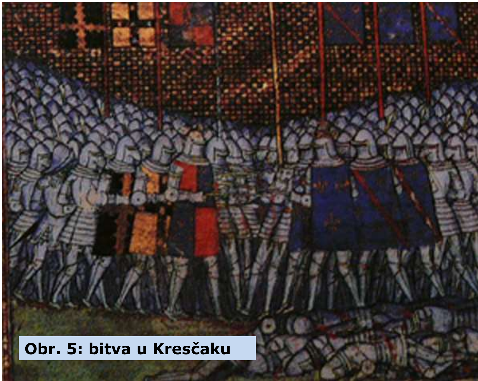
Obr. 5: bitva u Kresčaku