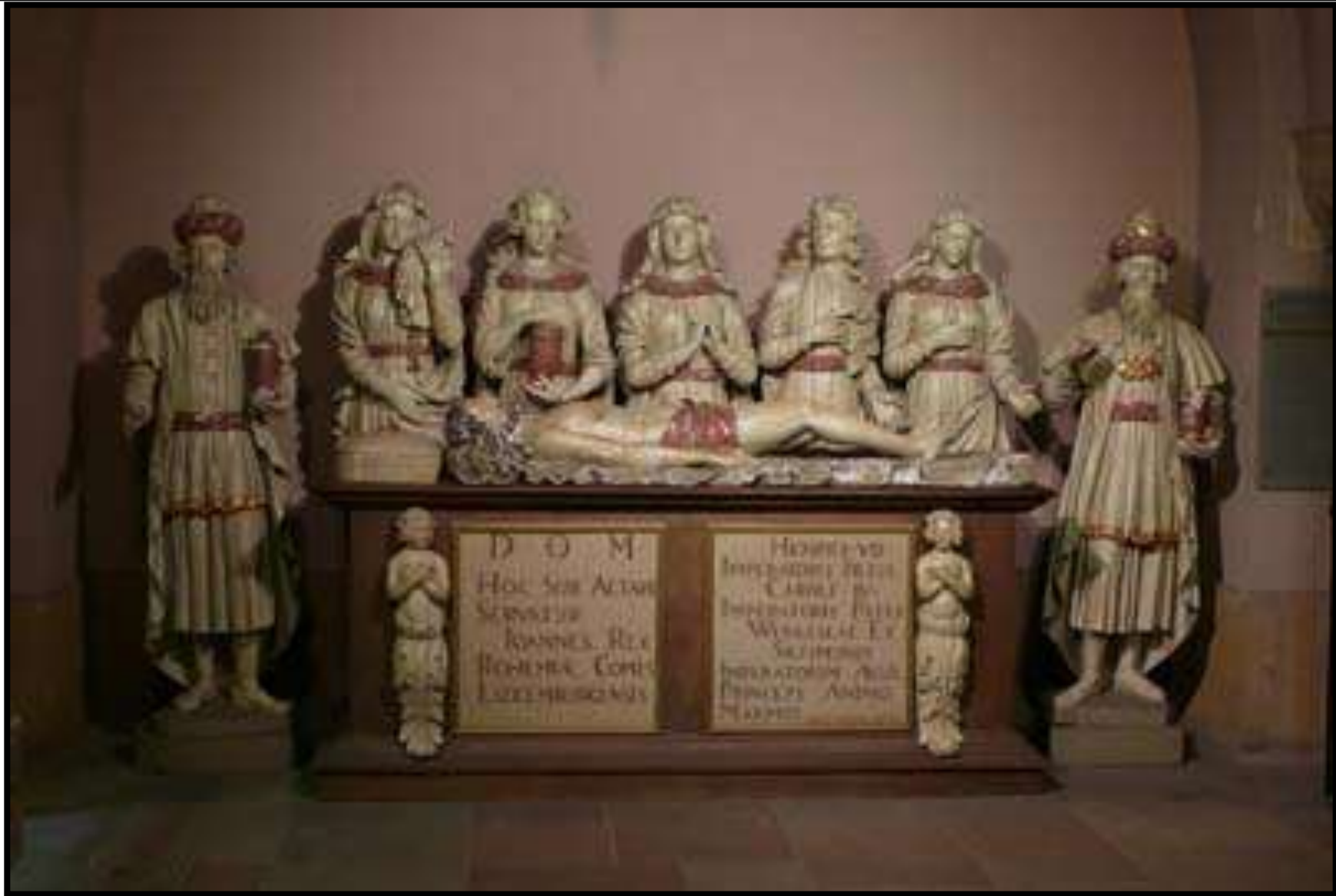
Obr. 3: hrobka Jana Lucemburského v Lucemburku