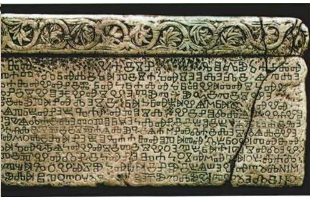
Obr. 7 a 8

11 12 13 14 15 16 17 18 19 20 21 22 23 24 25 26 27 28 29 30 31 32 33 34 35 36 37 38 39 40 41 42 43 44 45 46 47 48 49 50 51 52 53 54 55 56 57 58 59 60 61 62 63 64 65 66 67 68 69 70 71 72 73 74 75 76 77 78 79 80 81 82 83 84 85 86 87 88 89 90 91 92 93 94 95 96 97 98 99 100