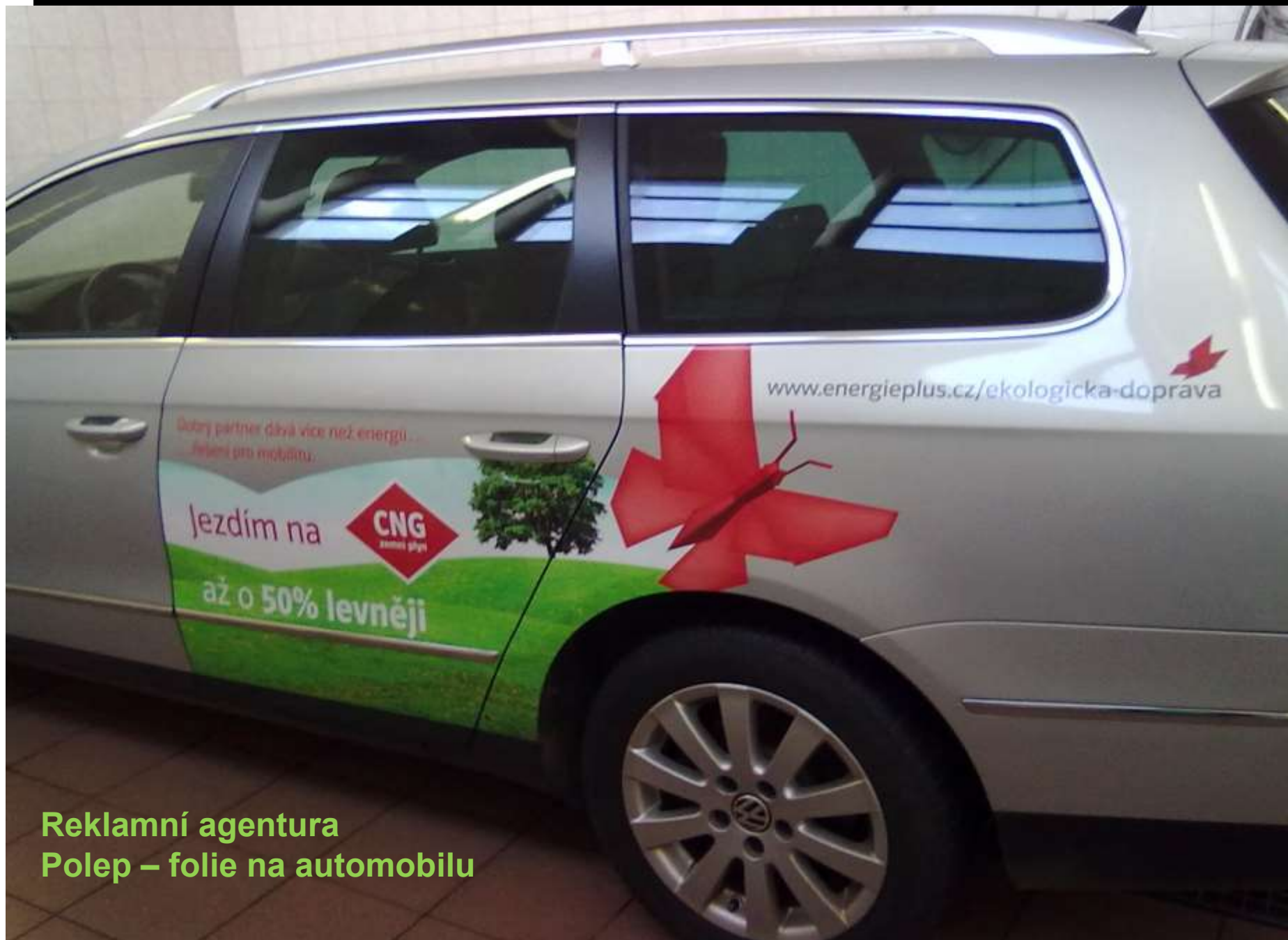
Reklamní agentura Polep – folie na automobilu