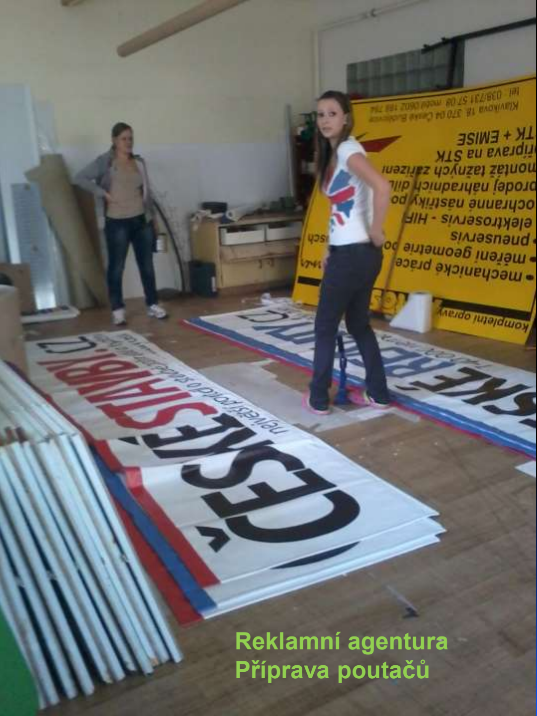
Reklamní agentura Příprava poutačů