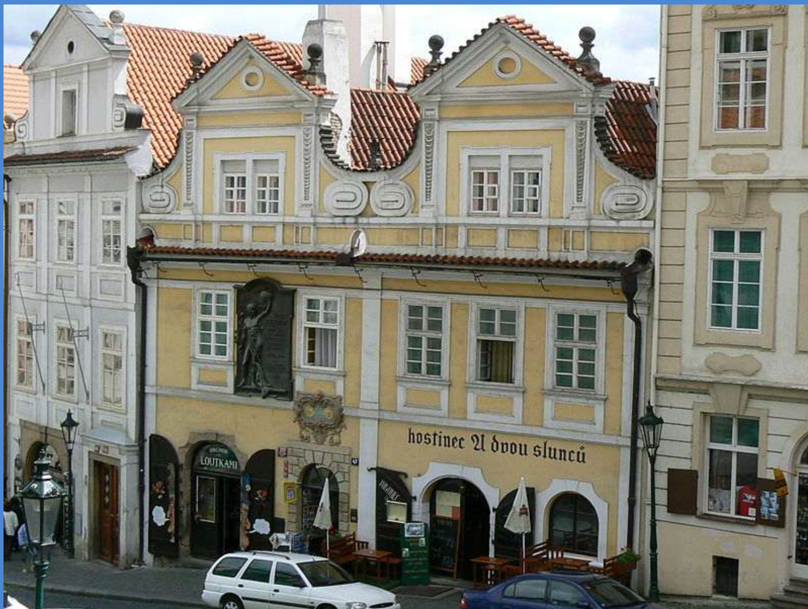
Obr. 1 DŮM U DVOU SLUNCŮ