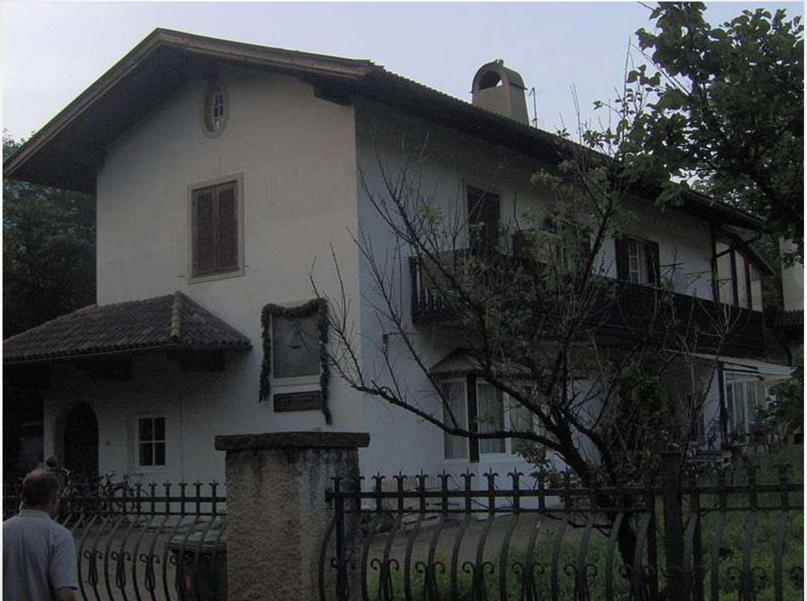
● Obr. 2 Dům, v kterém Havlíček při svém pobytu v Brixenu bydlel ●