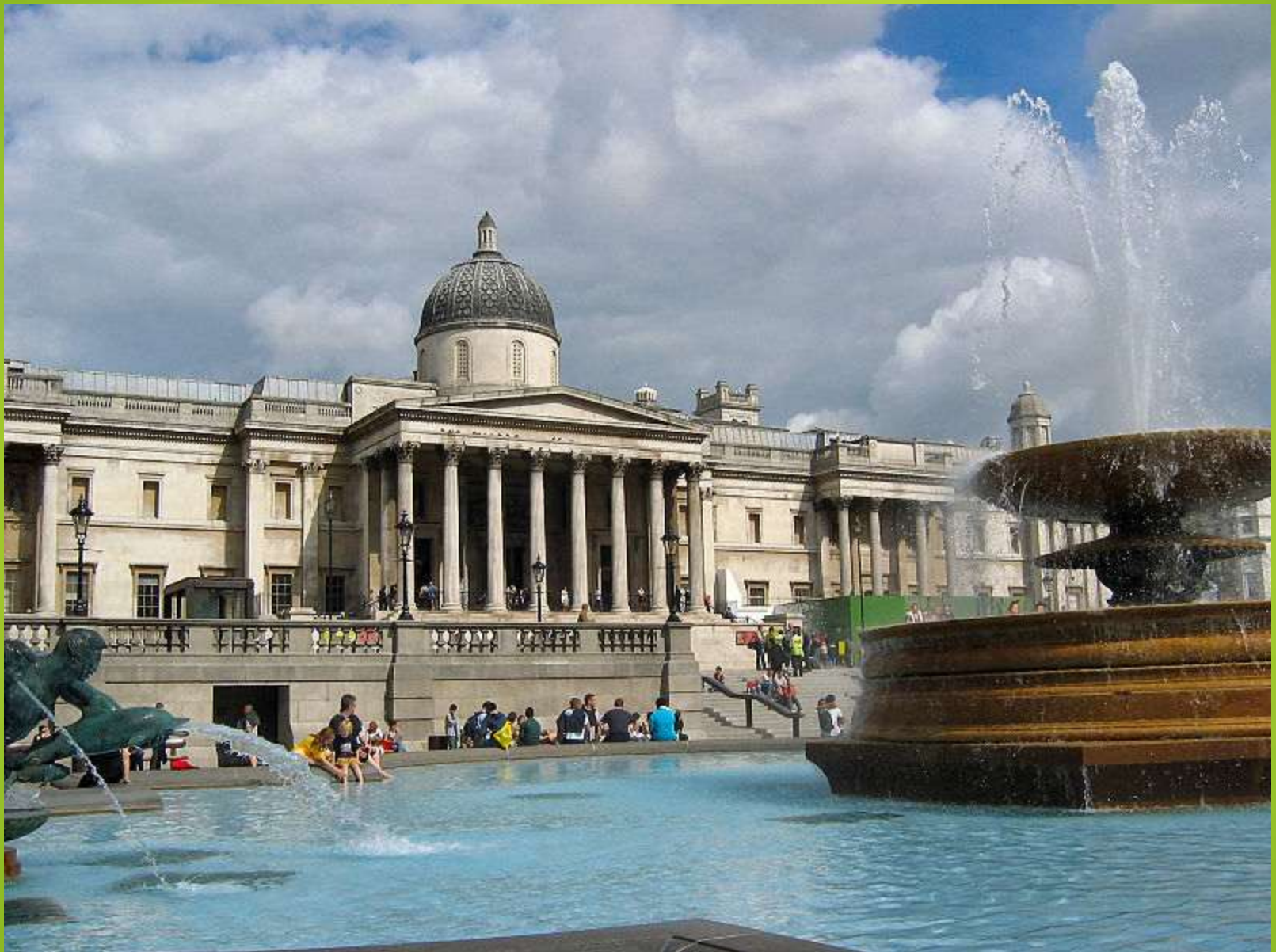
Obr. 3 Národní galerie, Londýn