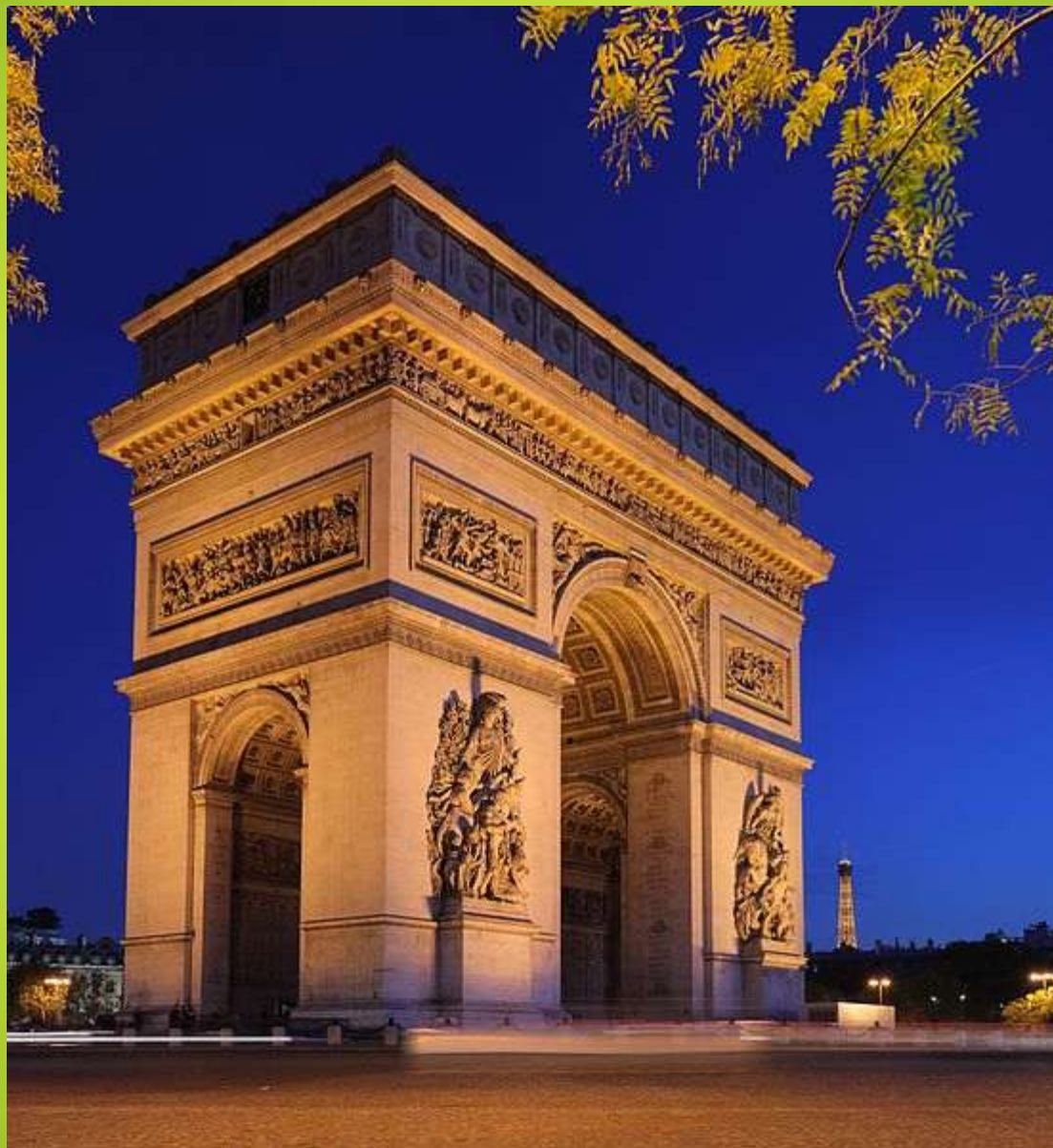
Obr. 2 Vítězný oblouk, Paříž