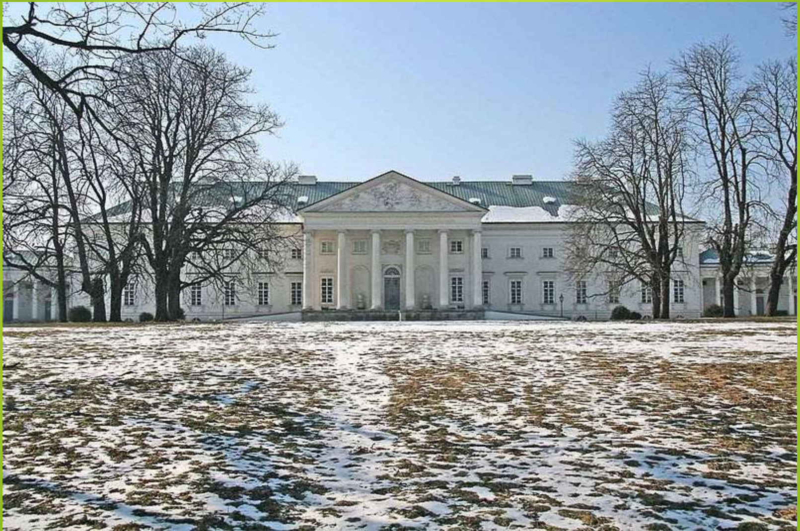
Obr. 8 Kačina