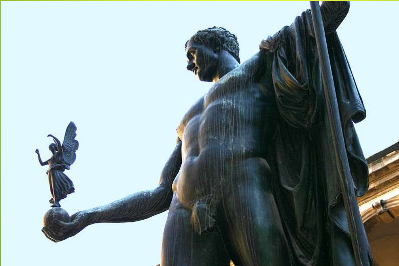
Obr. 6 Napoleon