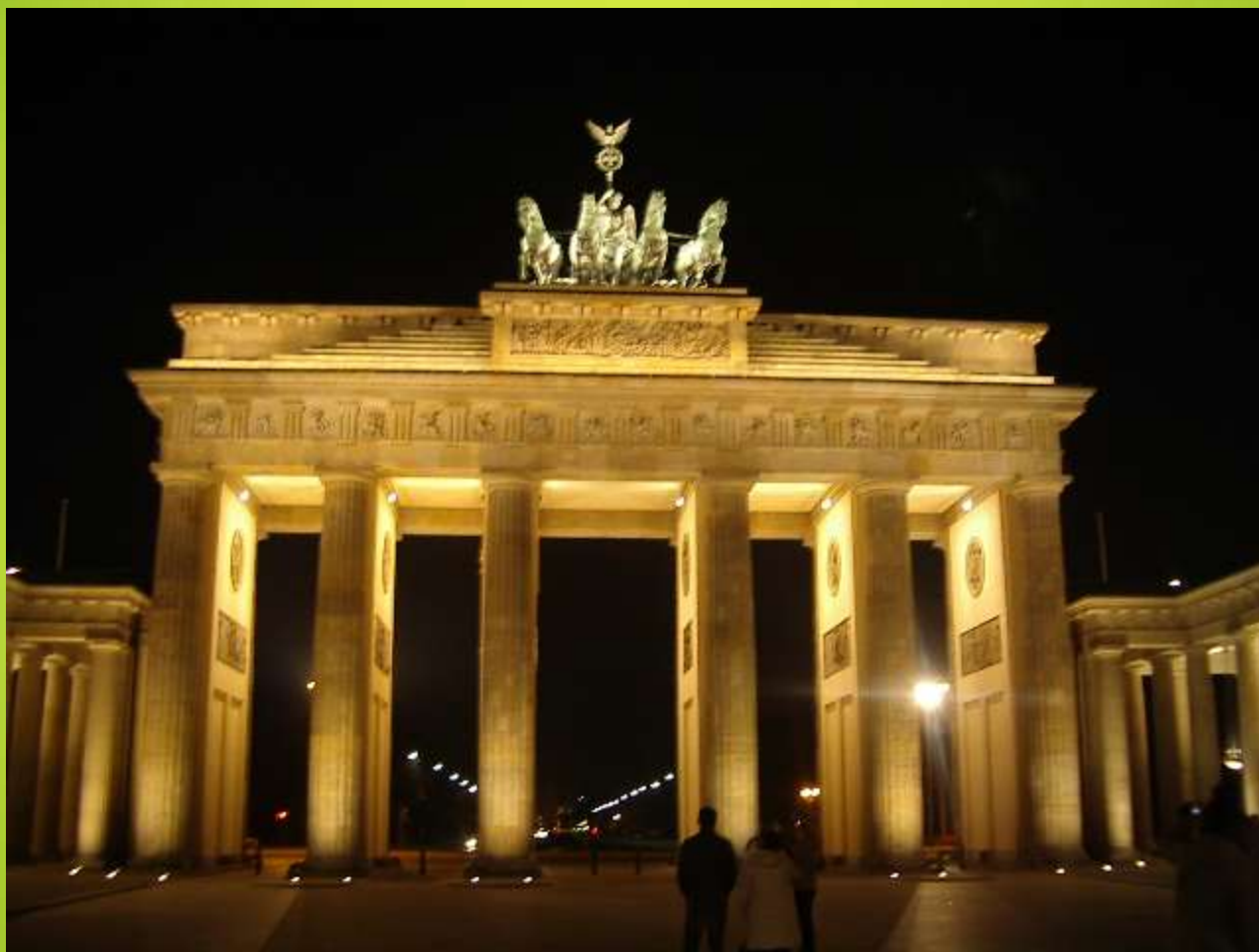
Obr. 4 Braniborská brána, Berlín