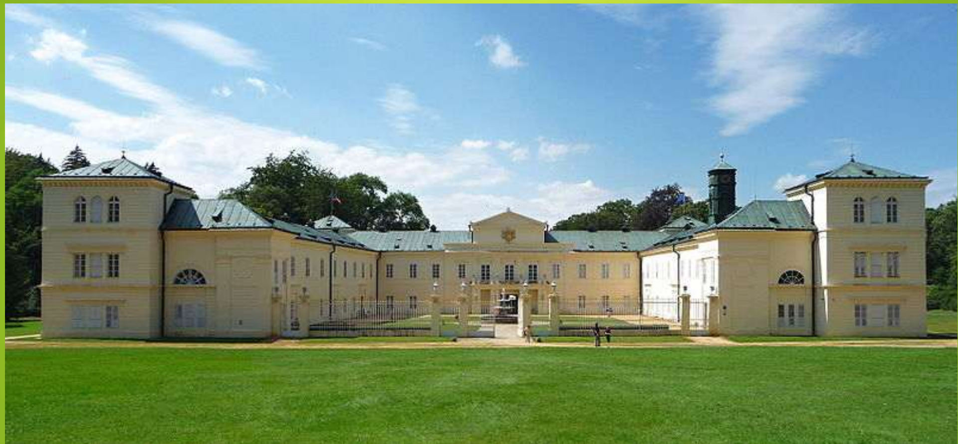
Obr. 10 Kynžvart