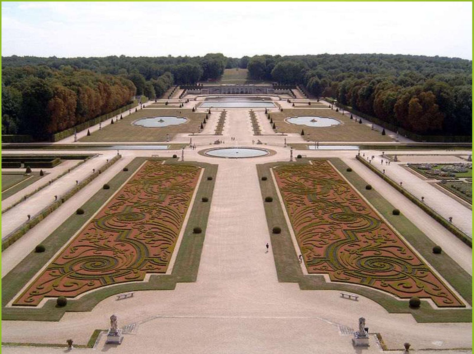
Obr. 1 Francouzský park