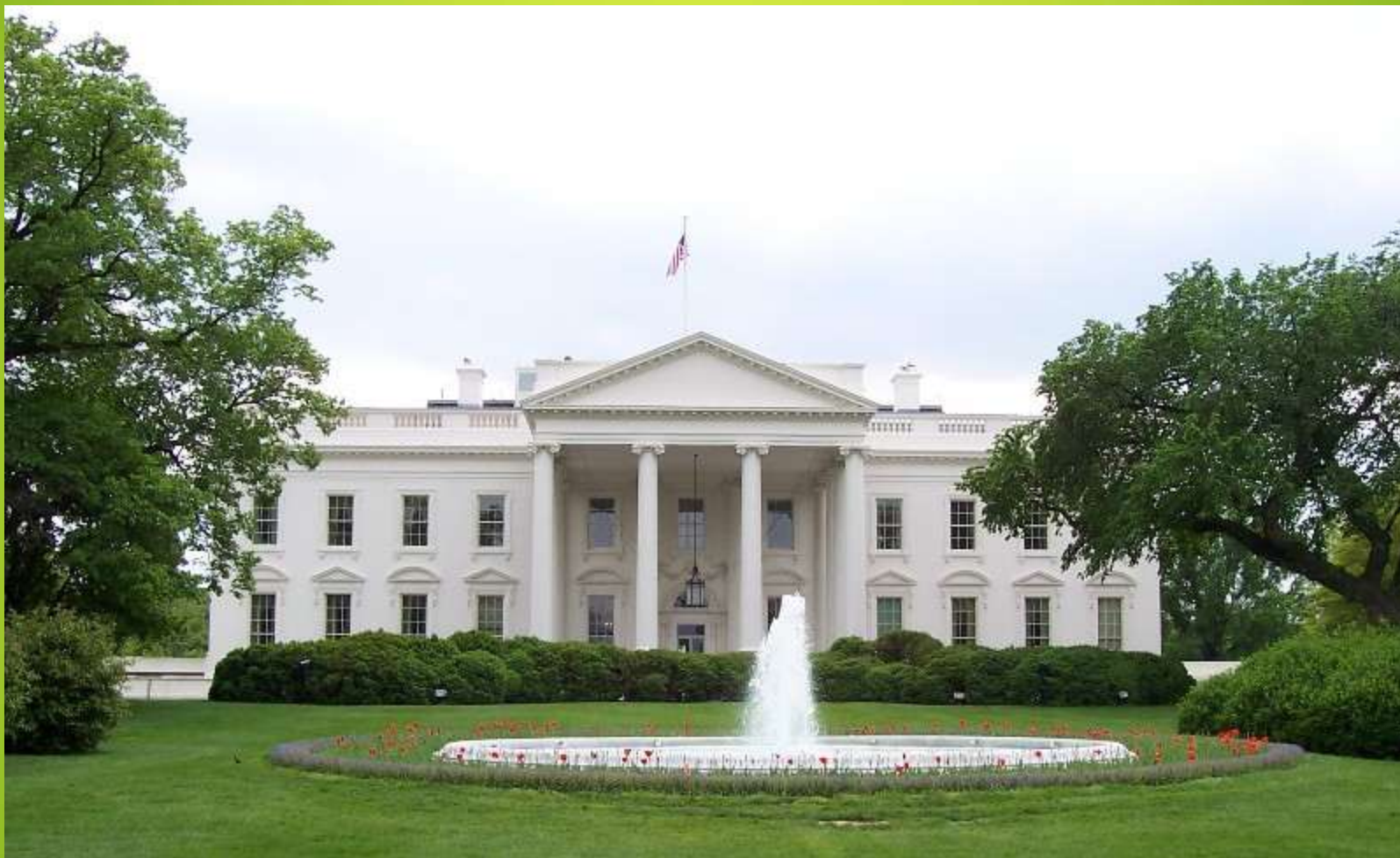
Obr. 5 Bílý dům