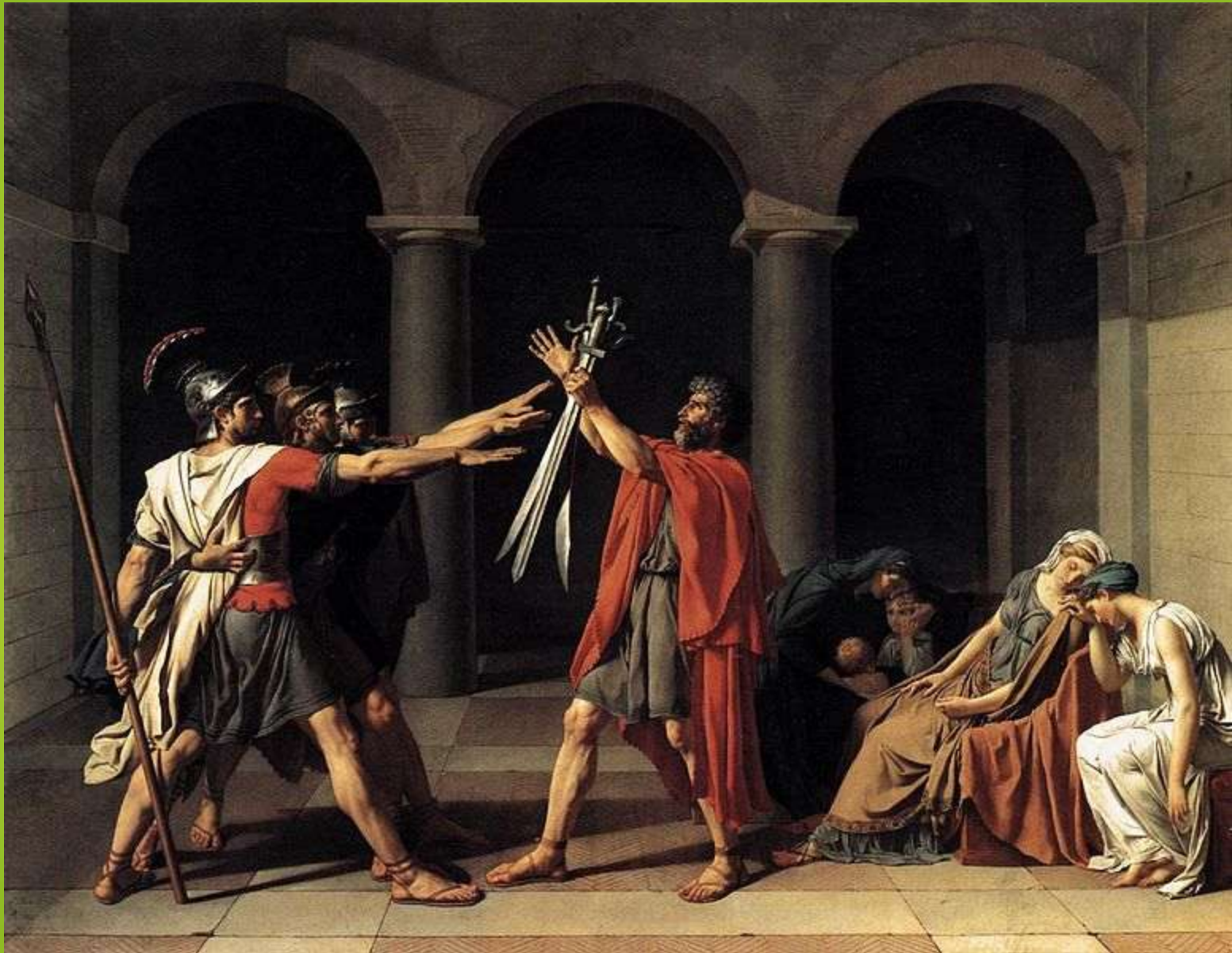
Obr. 7 Příklad přísahy Horatiů, J. L. David