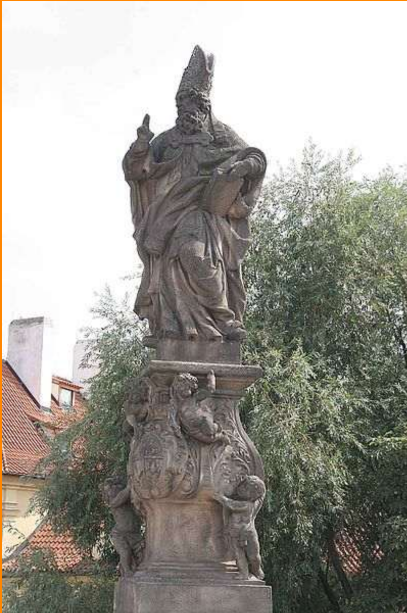
Svatý Vojtěch, Karlův most