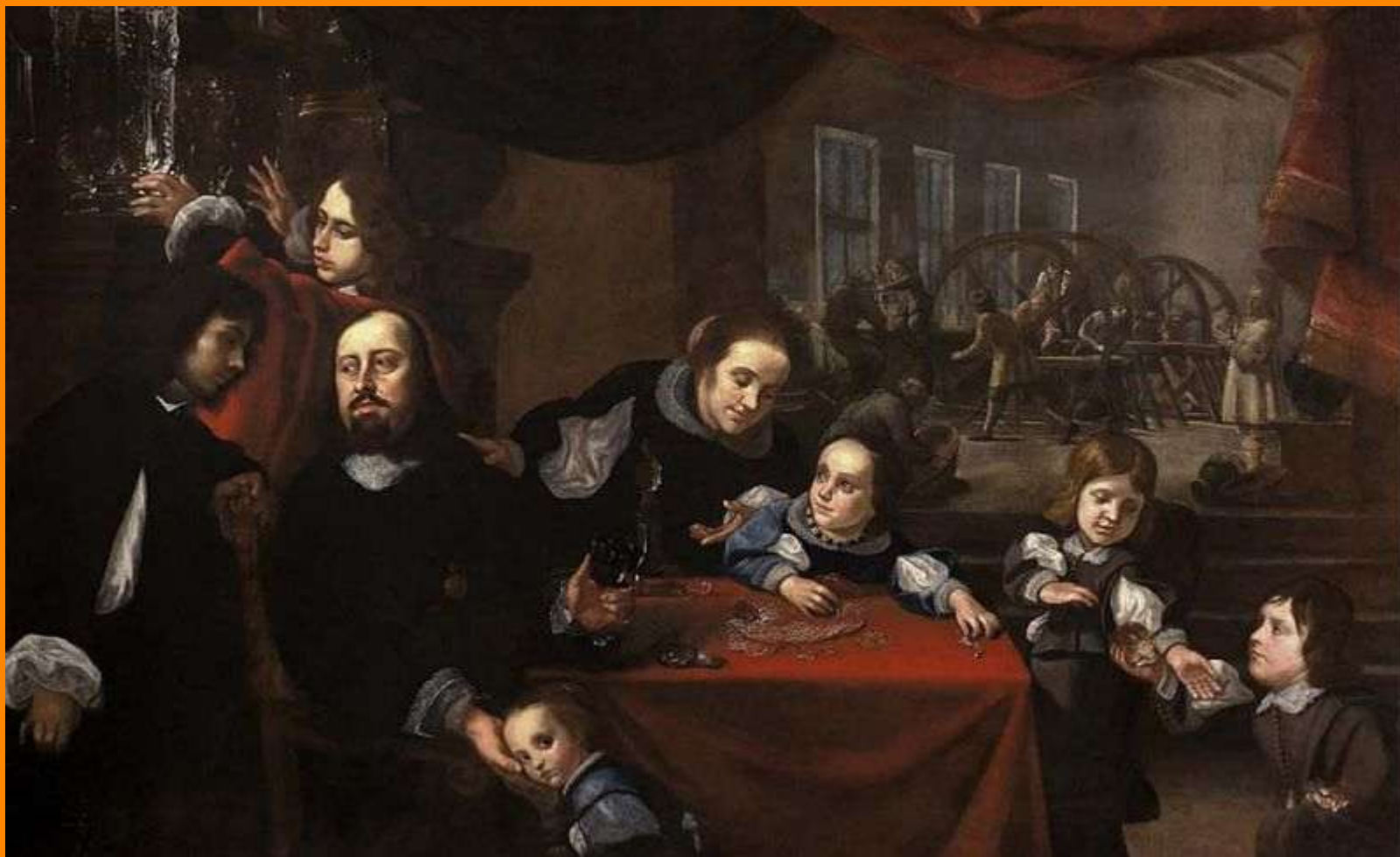
Karel Škréta, Portrét rodiny Dionýsia Miseroniho Obr. 5