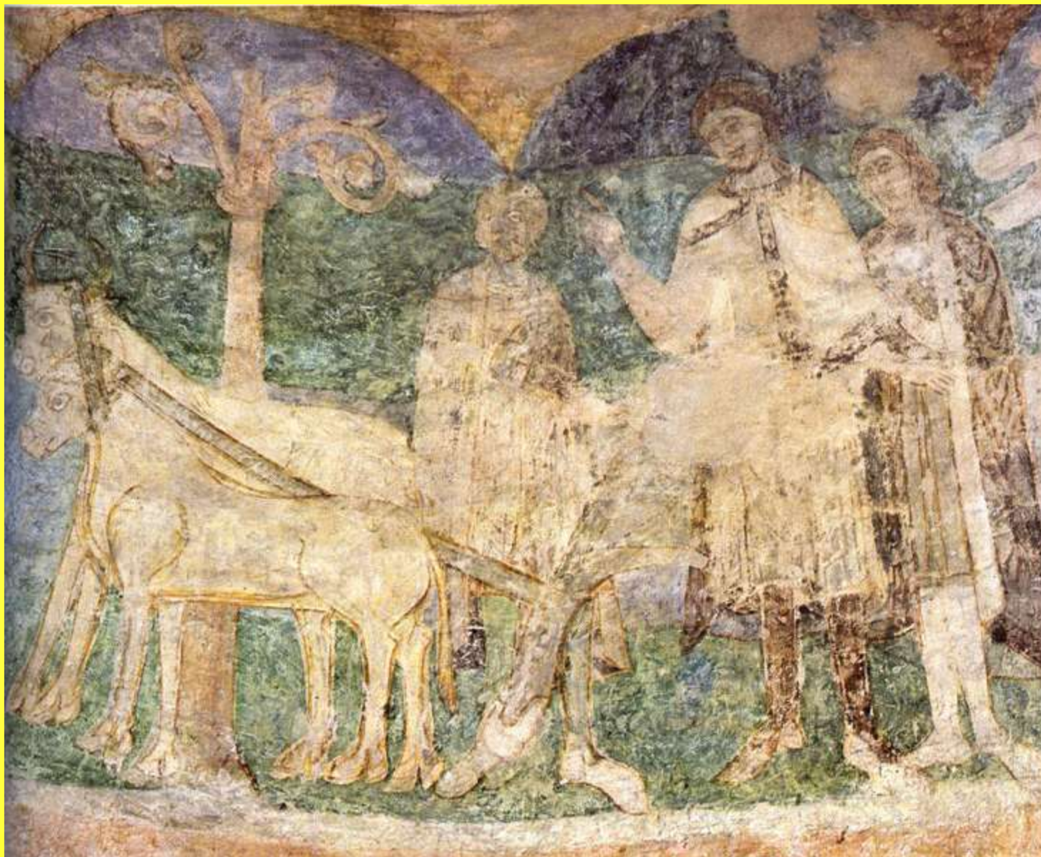
Obr. 4 Freska z rotundy sv. Kateřiny