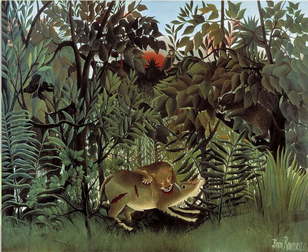
Henri Rousseau: Hladový lev